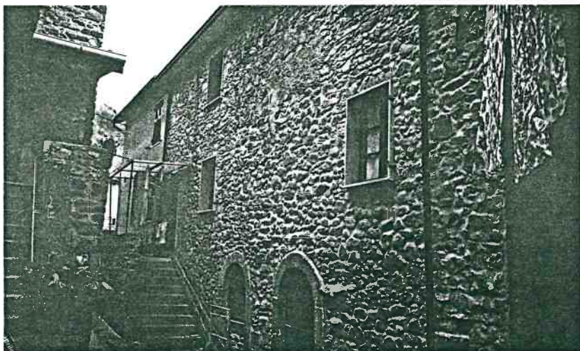
Vista prospettica del retro