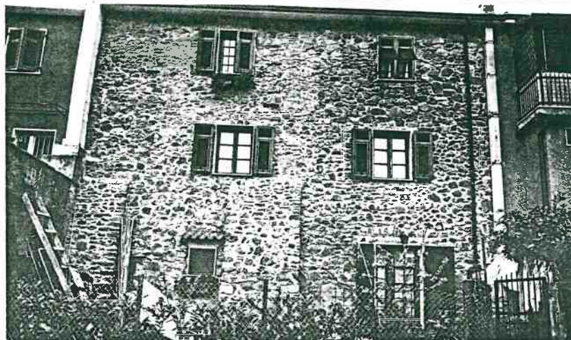
Vista prospettica del fronte