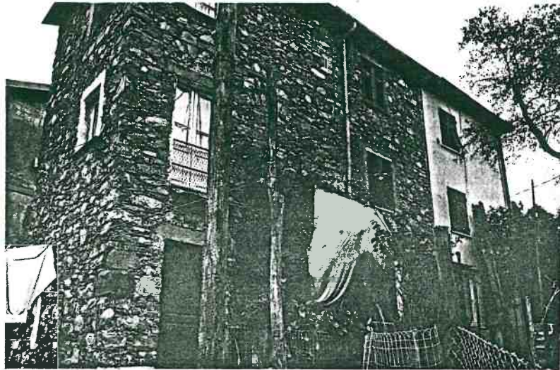
Vista prospettica del fronte