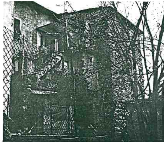
Vista prospettica del retro