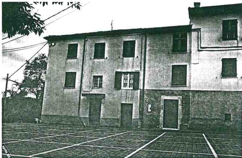
Vista prospettica del fronte