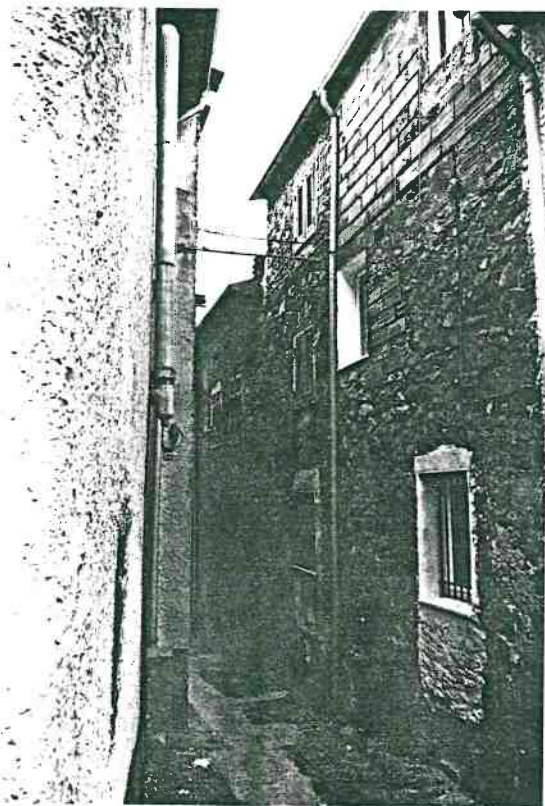
Vista prospettica del retro