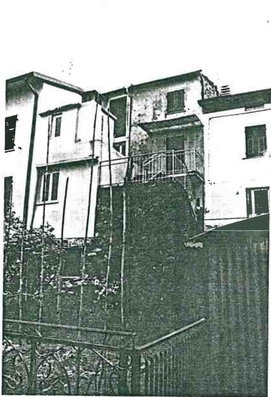
Vista prospettica del fronte