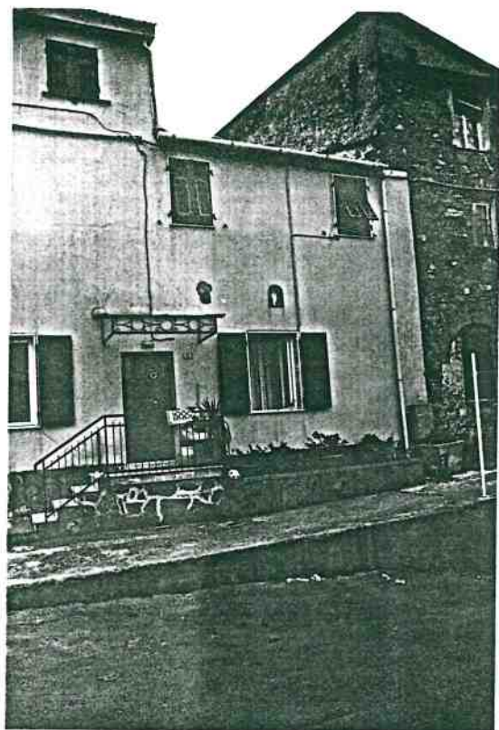
Vista prospettica del fronte