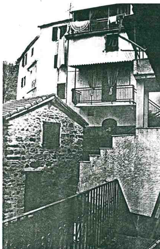
Vista prospettica del retro