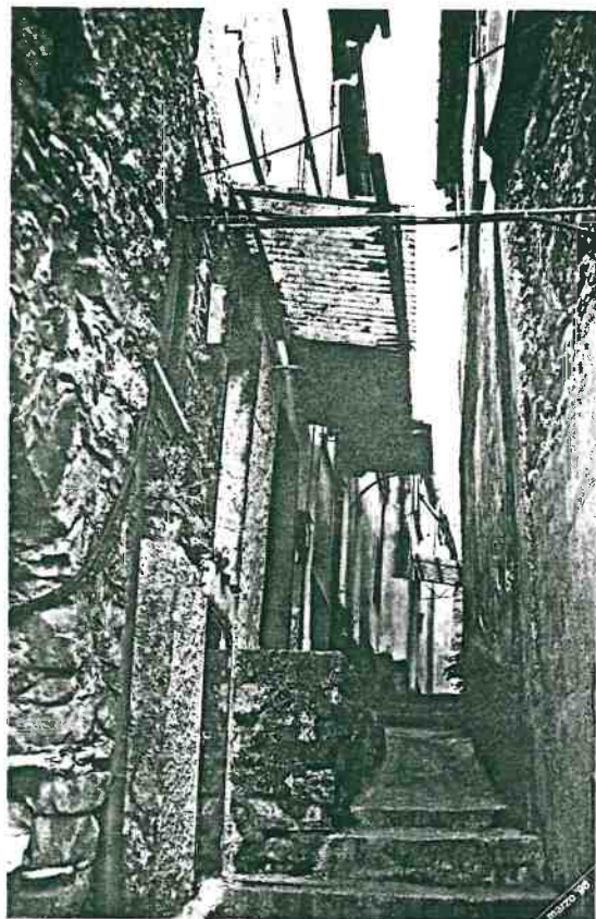
Vista prospettica del fronte