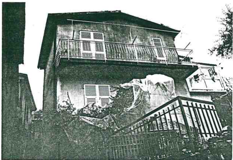
Vista prospettica del fronte