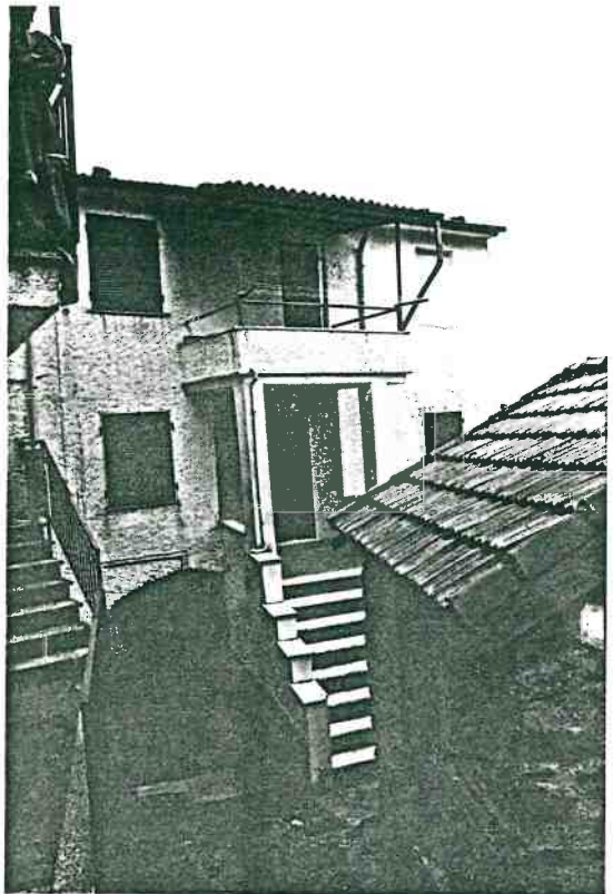
Vista prospettica del fronte