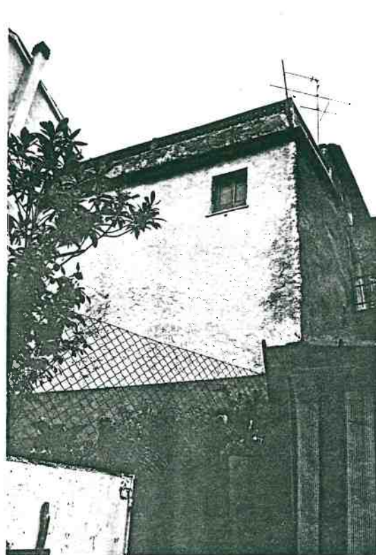
Vista prospettica del retro