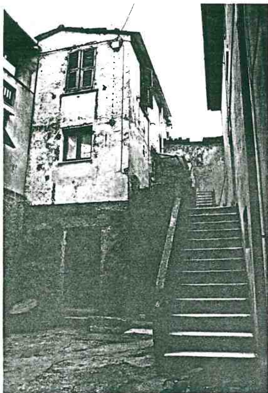
Vista prospettica del fronte

Mapp. 174/B - 175 - Loc. Montebello di Cima