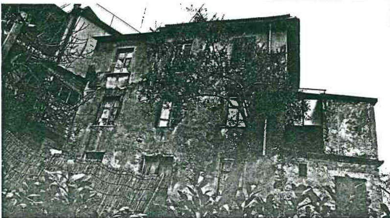
Vista prospettica del fronte