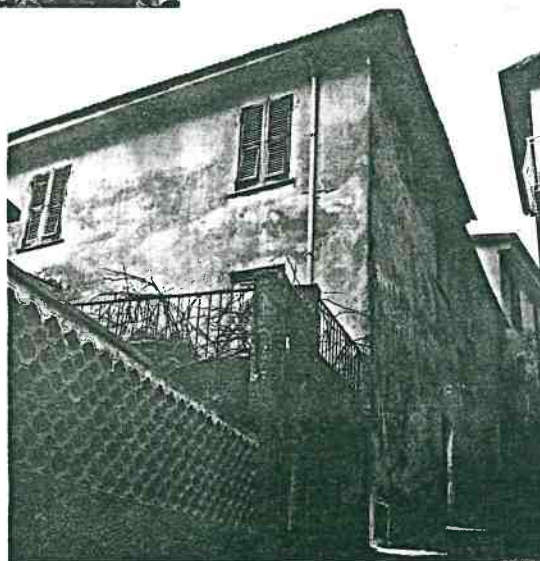
Vista prospettica del fianco e del retro