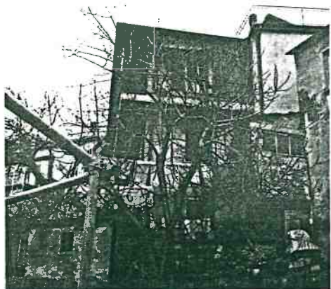
Vista prospettica del fianco