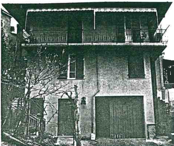
Vista prospettica del fronte