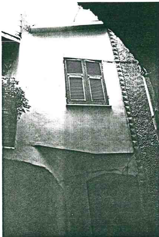
Vista prospettica del fronte