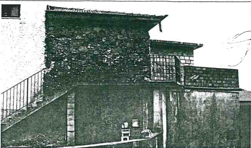
Vista prospettica del fronte