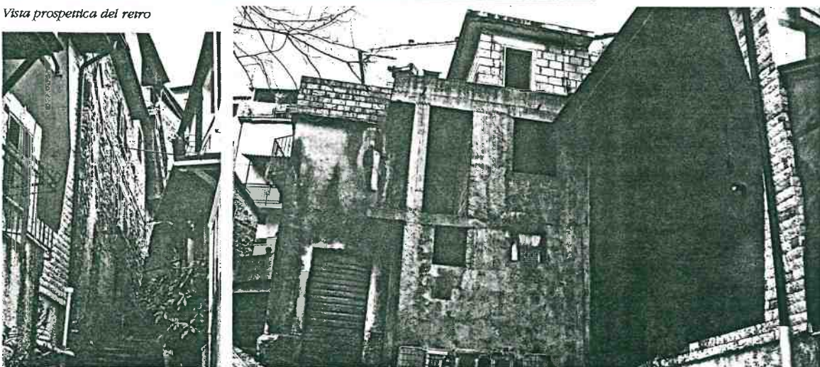
Vista prospettica del retro