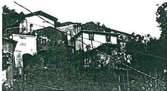
Vista prospettica del fronte