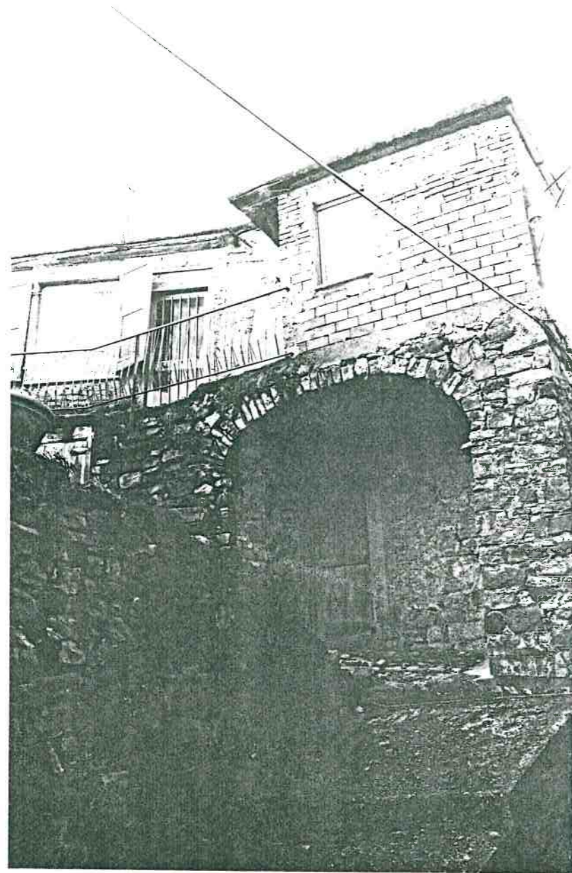
Vista prospettica del fronte da Via Borgo Vecchio