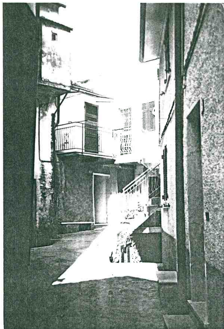
Vista prospettica del fronte da Via Poggio