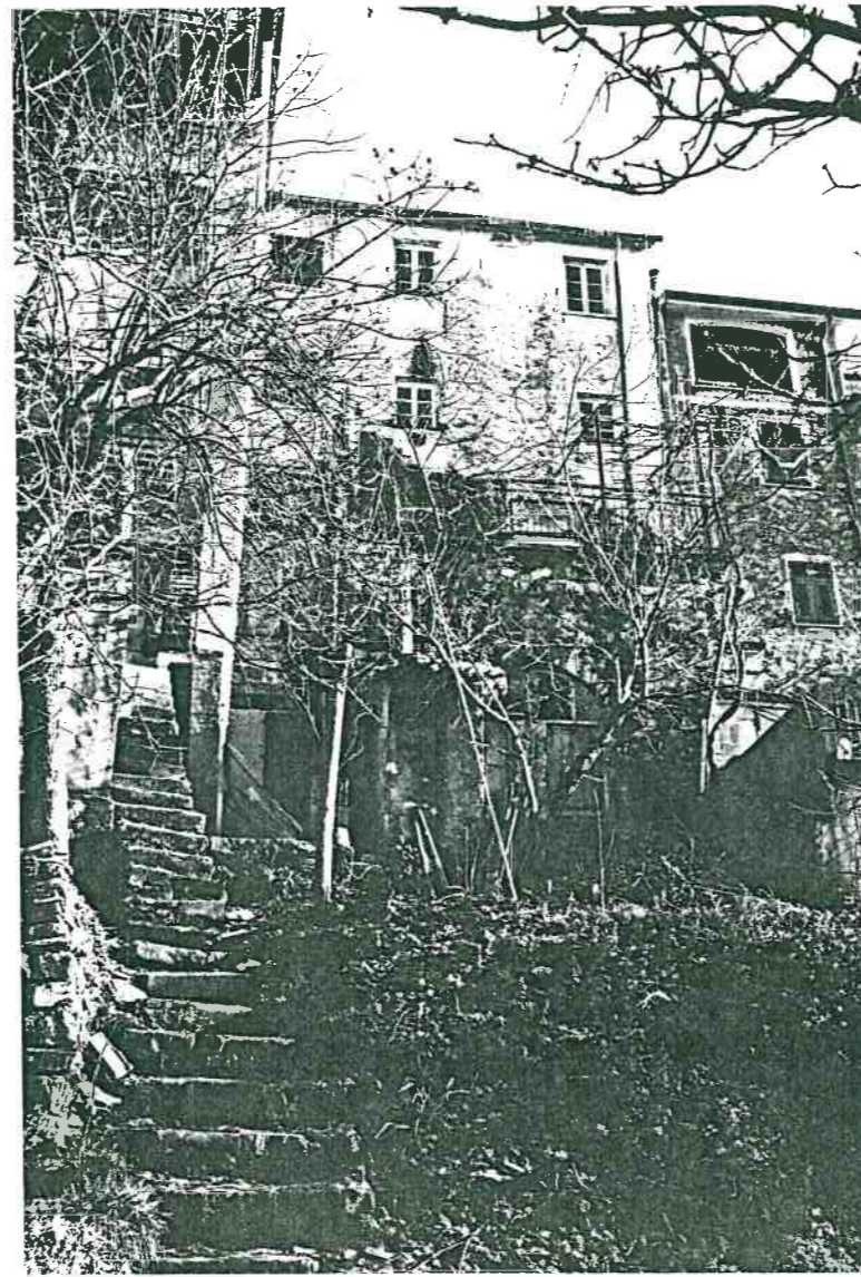
Vista prospettica dagli orti di Via Dietro le Mura