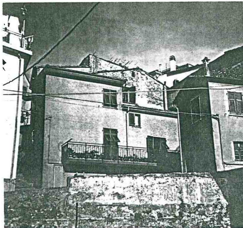
Vista prospettica del fronte da Piazza S. Maria