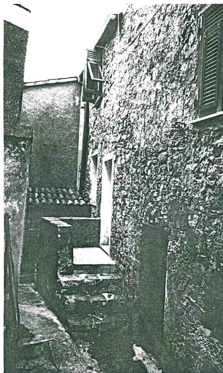
Vista prospettica del fianco da Via Poggio