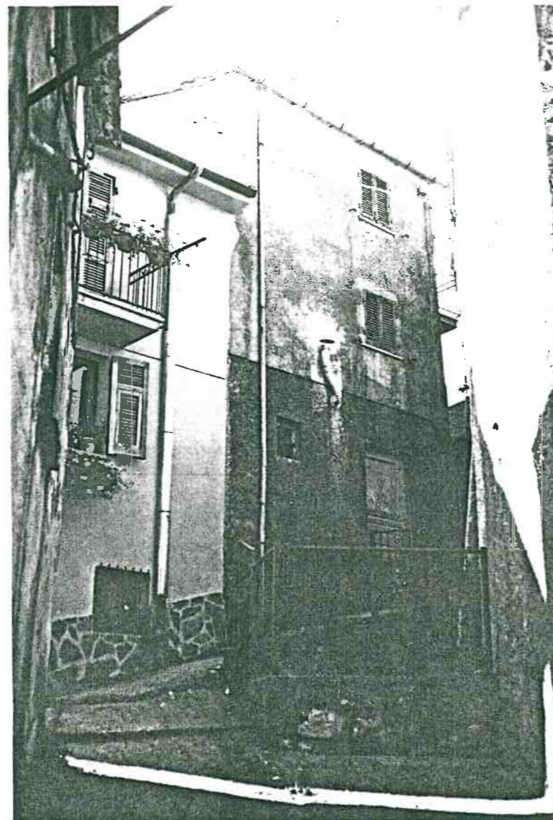
Vista prospettica del fianco da Via Poggio