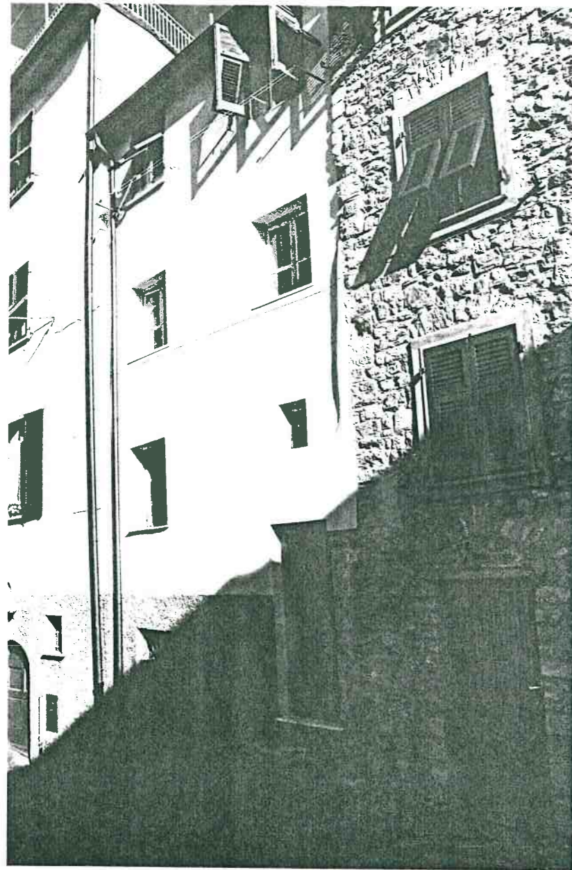
Vista prospettica del fronte da Via Poggio