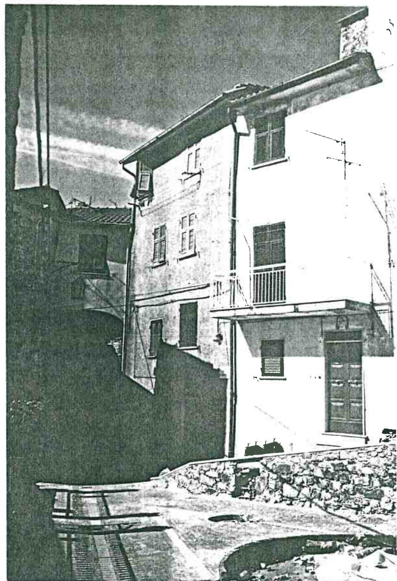
Vista prospettica del fronte da Via S. Maria