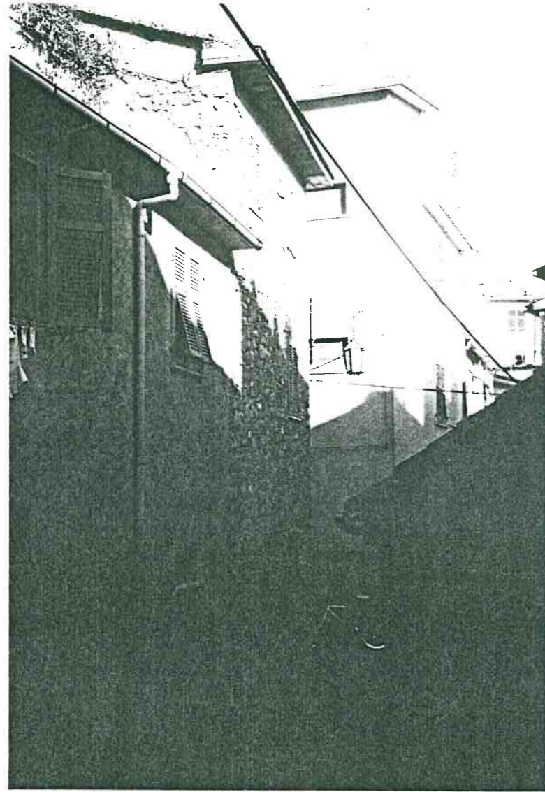
Vista prospettica da Via Marconi