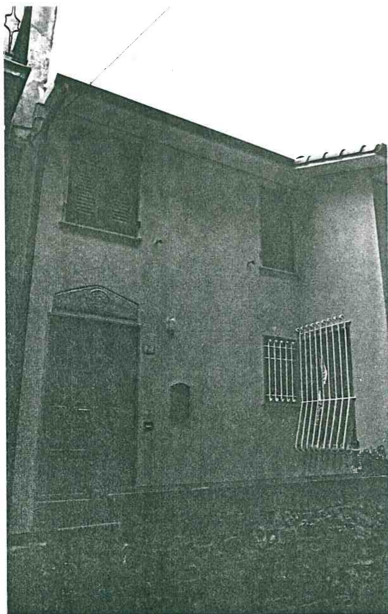
Vista prospettica da Via Roma