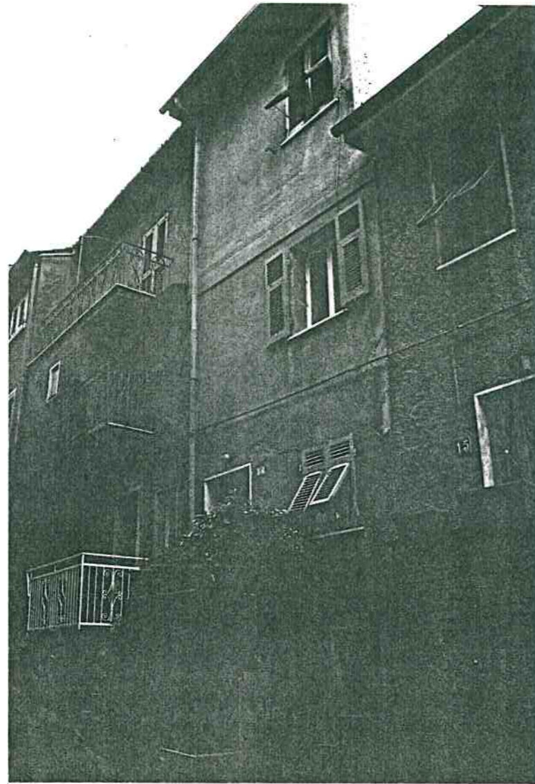
Vista prospettica da Via Roma