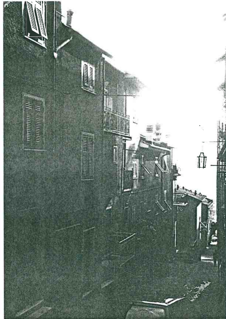
Vista prospettica da Via Roma