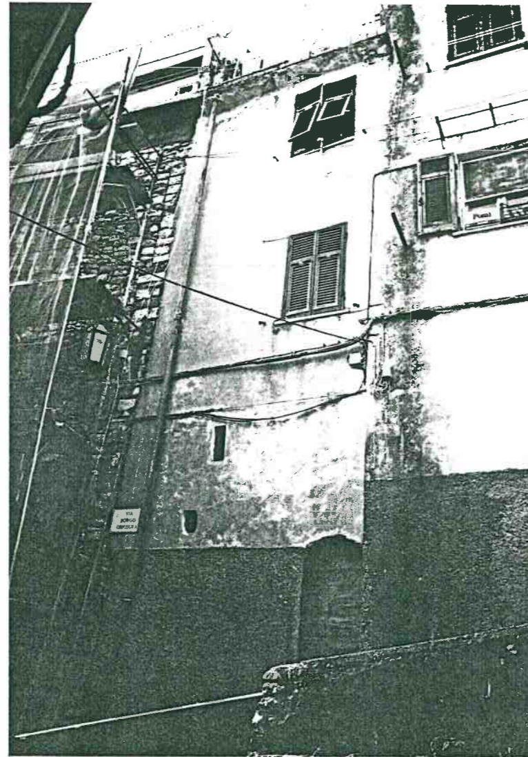
Vista prospettica da Via Borgo Chtusura