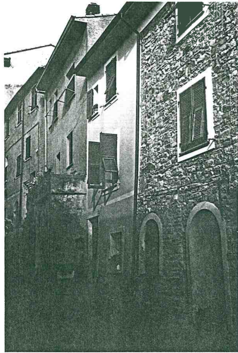
Vista prospettica da Via Roma