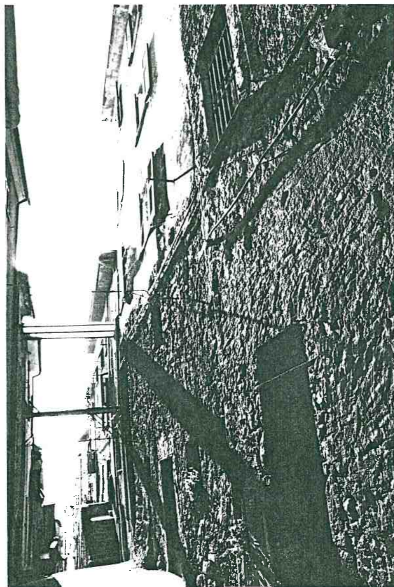
Vista prospettica da Via Borgo Chiusura