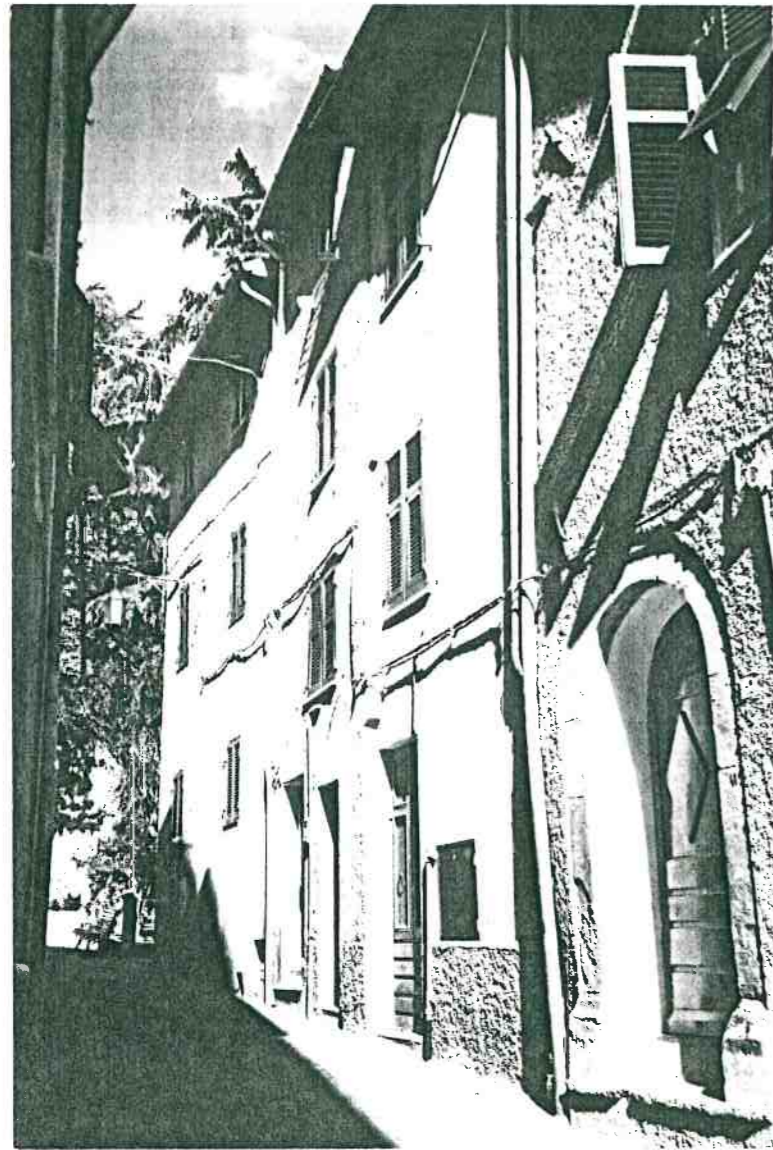
Vista prospettica da Via Roma