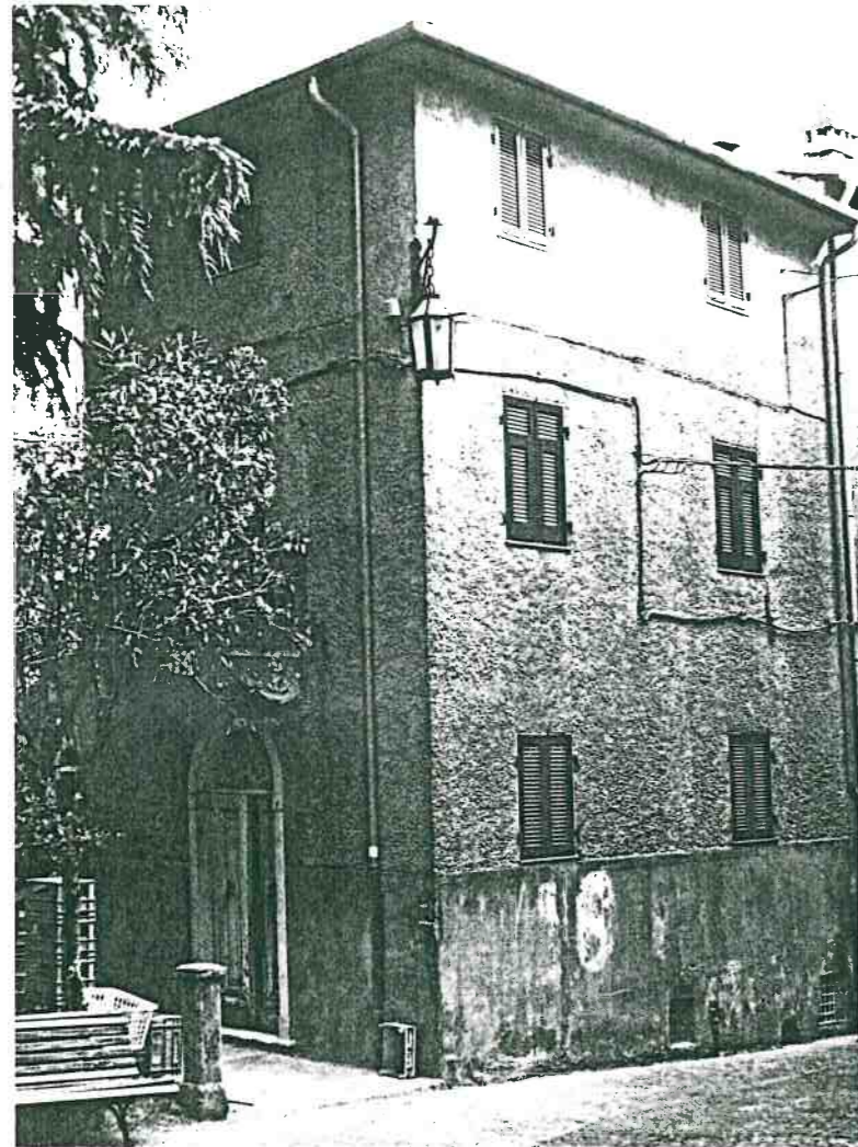
Vista prospettica del fianco da Piazza Maneotti