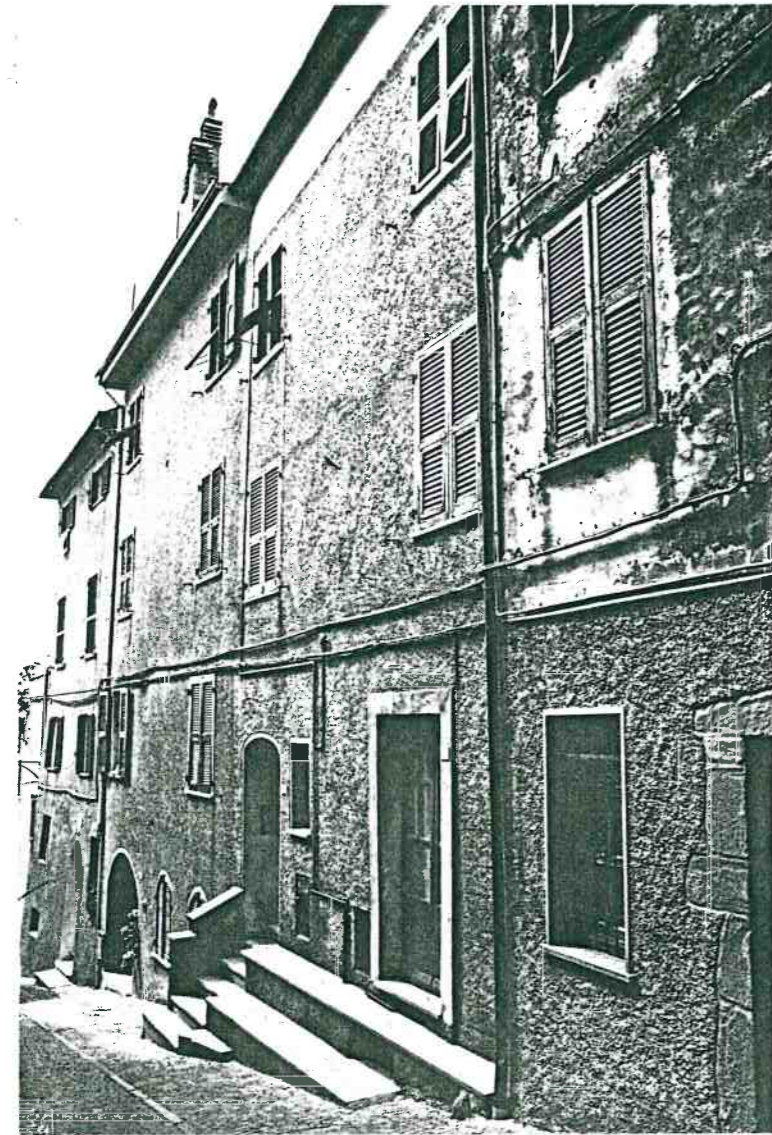
Vista prospettica da Via Roma