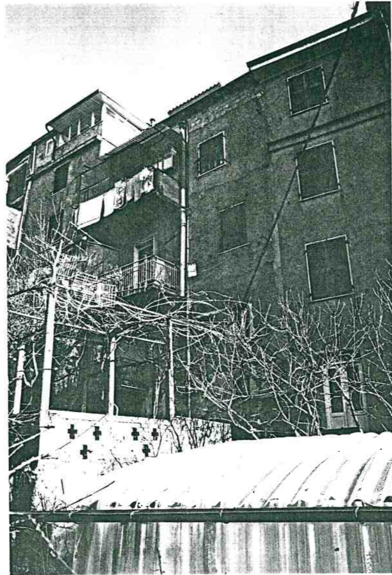
Vista prospettica dagli orti di Via Dietro le Mura