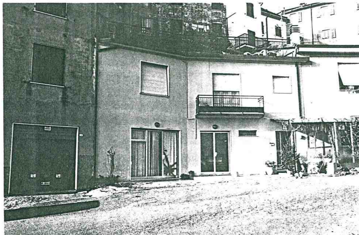
Vista prospettica del fronte da Via Codalina