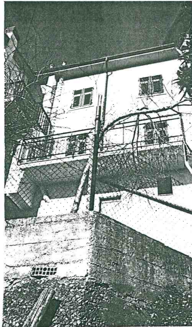
Vista prospettica del retro da Via Codaltna