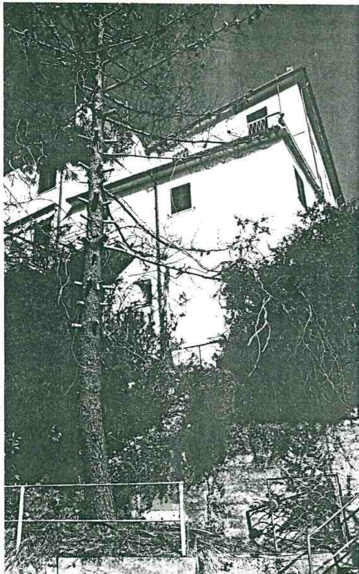
Vista prospettica del retro dalla strada Provinciale