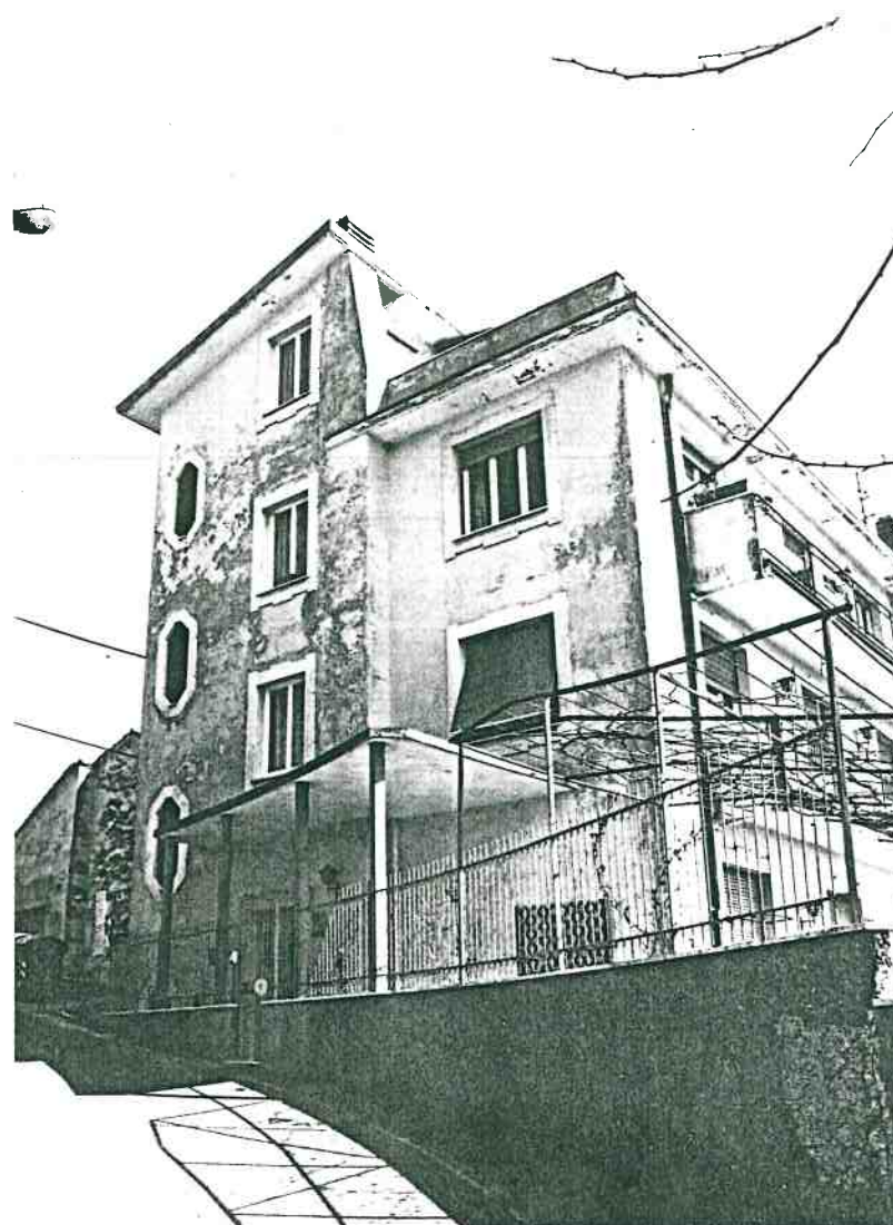
Vista prospettica del fronte dalla strada Provinciale