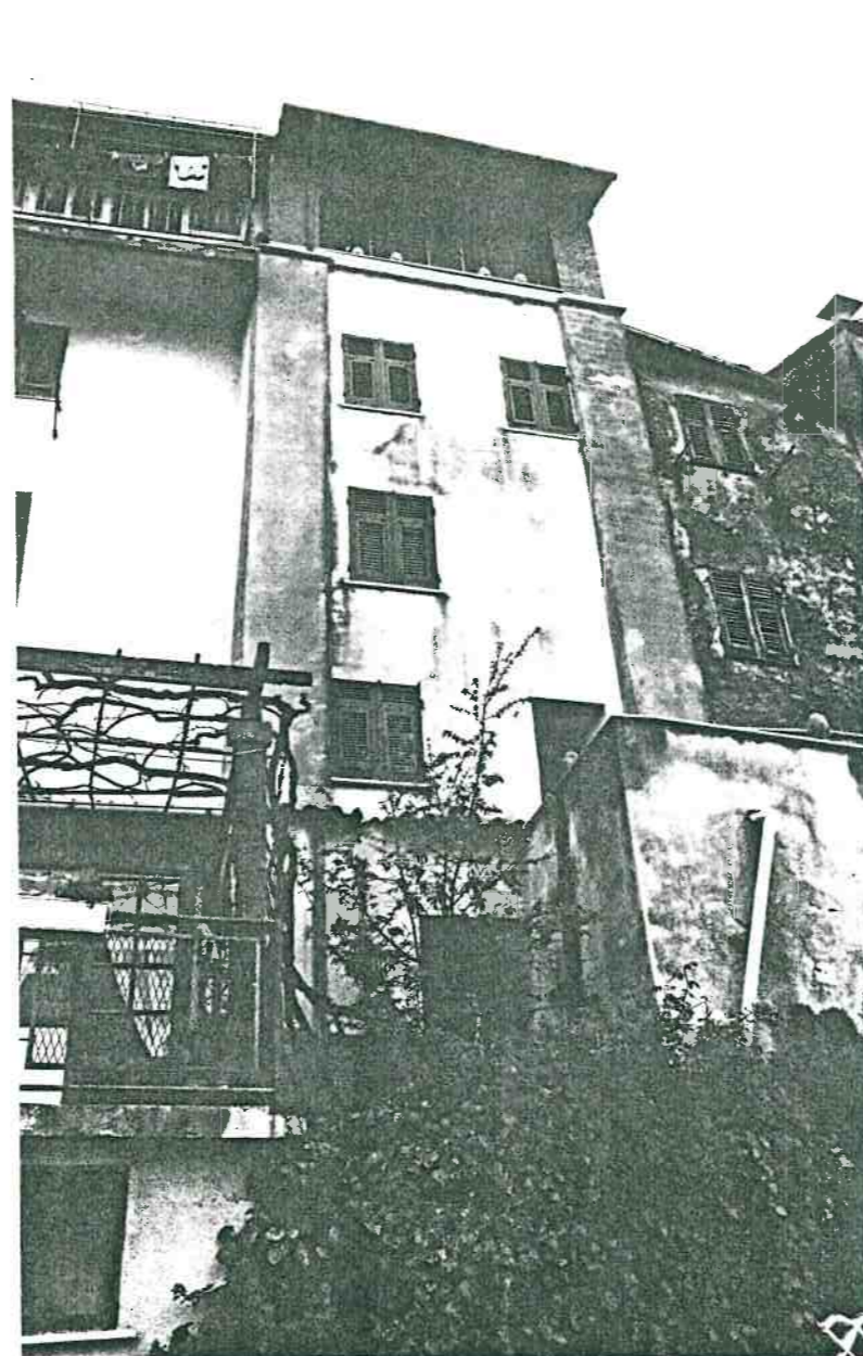
Vista prospettica dei retro dalla strada Provinciale