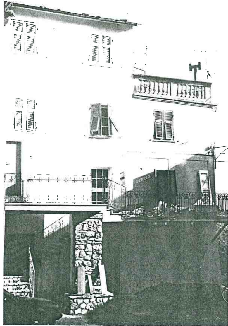
Vista prospettica del fronte da Piazza S. Maria