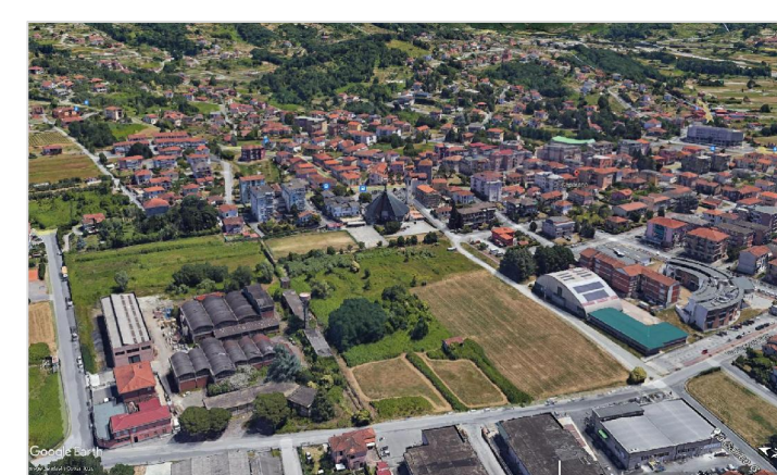
EDIFICI COMMERCIALI ARTIGIANALI