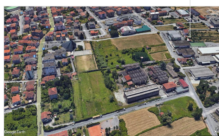
EDIFICI COMMERCIALI ARTIGIANALI