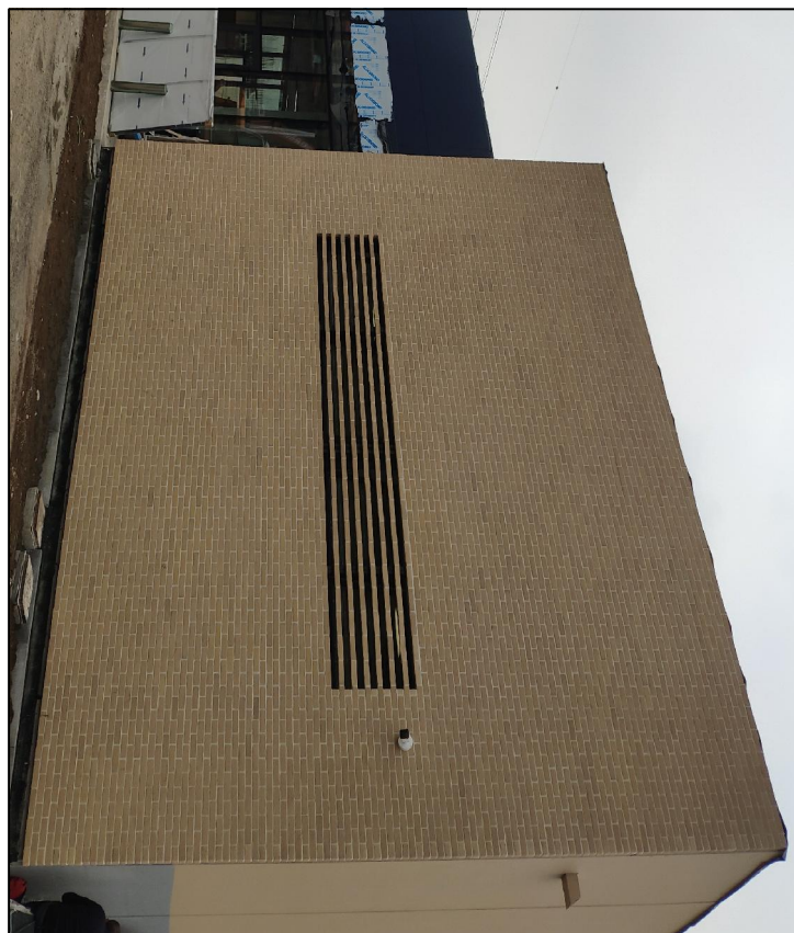
RIVESTIMENTO MATTONI FACCIAVISTA TIPO ISOVISTA