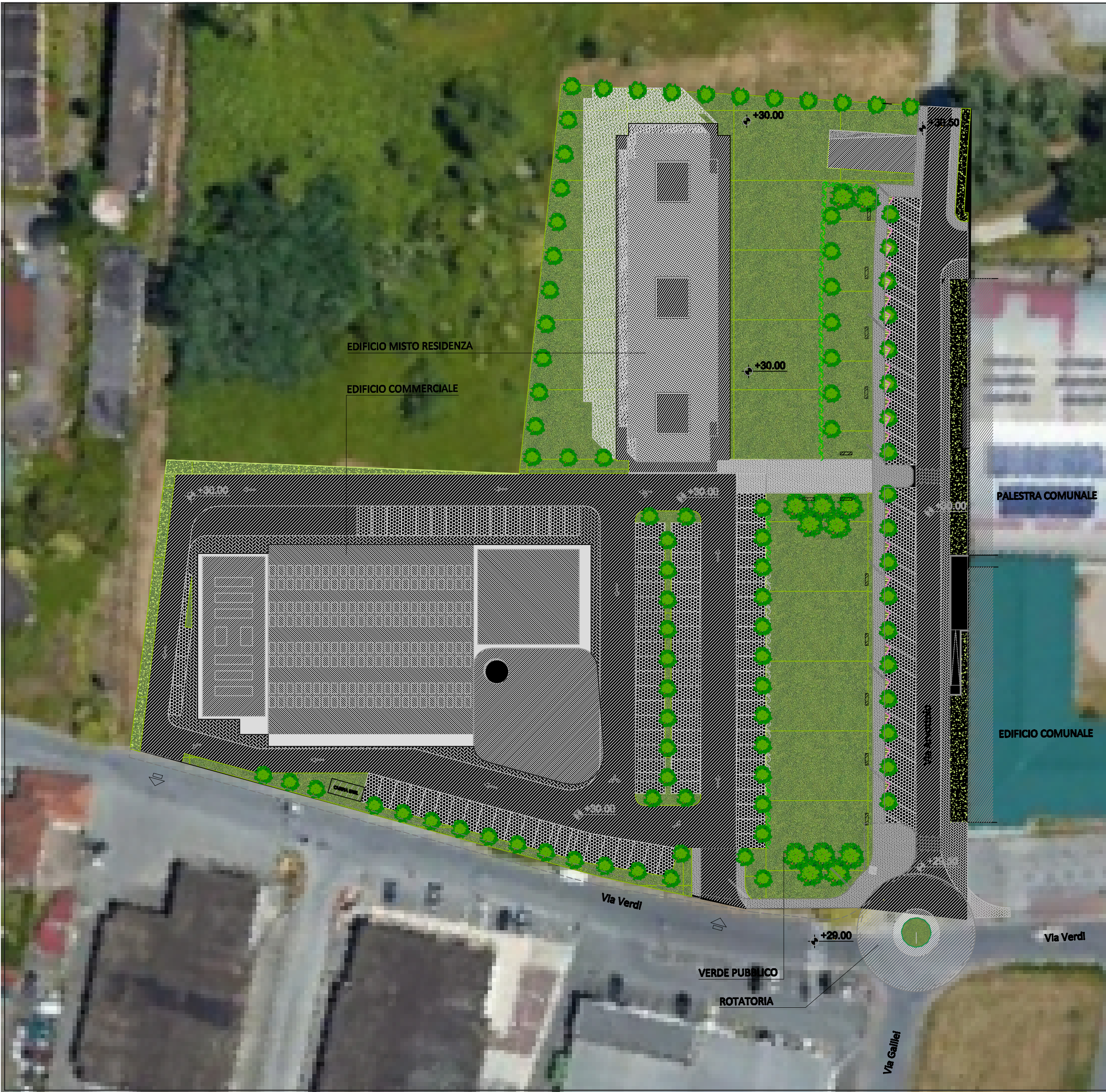
Planimetria complessiva con fotoinserimento