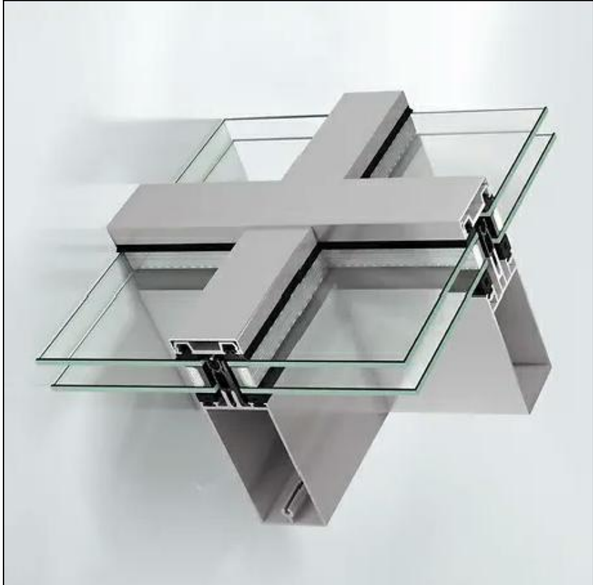
FACCIATA CONTINUA TIPO SCHUCCO FWS50 CON SOPRALUCE APRIIBILI